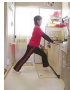
ふくらはぎ伸ばし