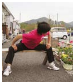
内ももと背中伸ばし