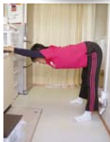
肩と太もも裏のばし