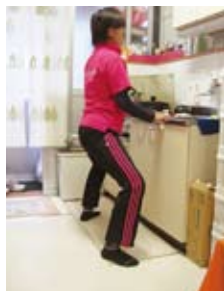
ハーフスクワット