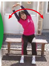
背伸び・体側伸ばし