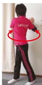
上体ひねり(左右・斜め上)