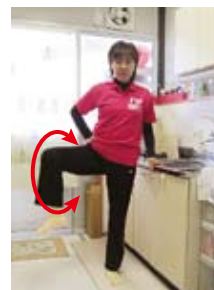
股関節のほぐし(膝を伸ばして・膝を曲げて・内回し外回し)